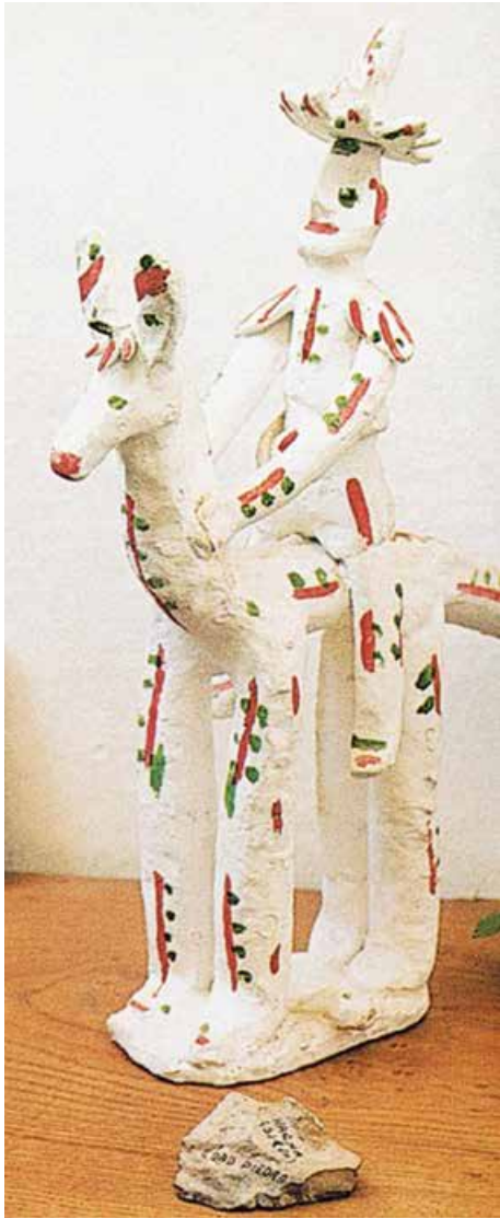
Eine von Mirós geliebten kleinen Tonfiguren, die er schon als Kind gesammelt hat

Als kleiner Junge verbrachte Miró die Ferien oft bei seinen Großeltern auf der spanischen Insel Mallorca. Dort gab es auf den Jahrmärkten kleine Tonpfeifen-Figuren zu kaufen, »Xiurells« genannt: Reiter auf Pferden, Frauenfiguren oder Stiere, die mit Strichen und Punkten in Rot-Gelb, Rot-Grün oder Rot-Grün-Gelb bemalt waren. Miró liebte diese »Xiurells« als Kind, aber auch noch, als er längst groß und ein berühmter Maler war. Wie intensiv diese Farben auf dem weißen Grund leuchten! »Genauso sollen die Farben auch in meinen Bildern wirken!«, beschloss er. Deshalb verwendete er für seine Malerei reine – das bedeutet einfach: ungemischte – Farben.